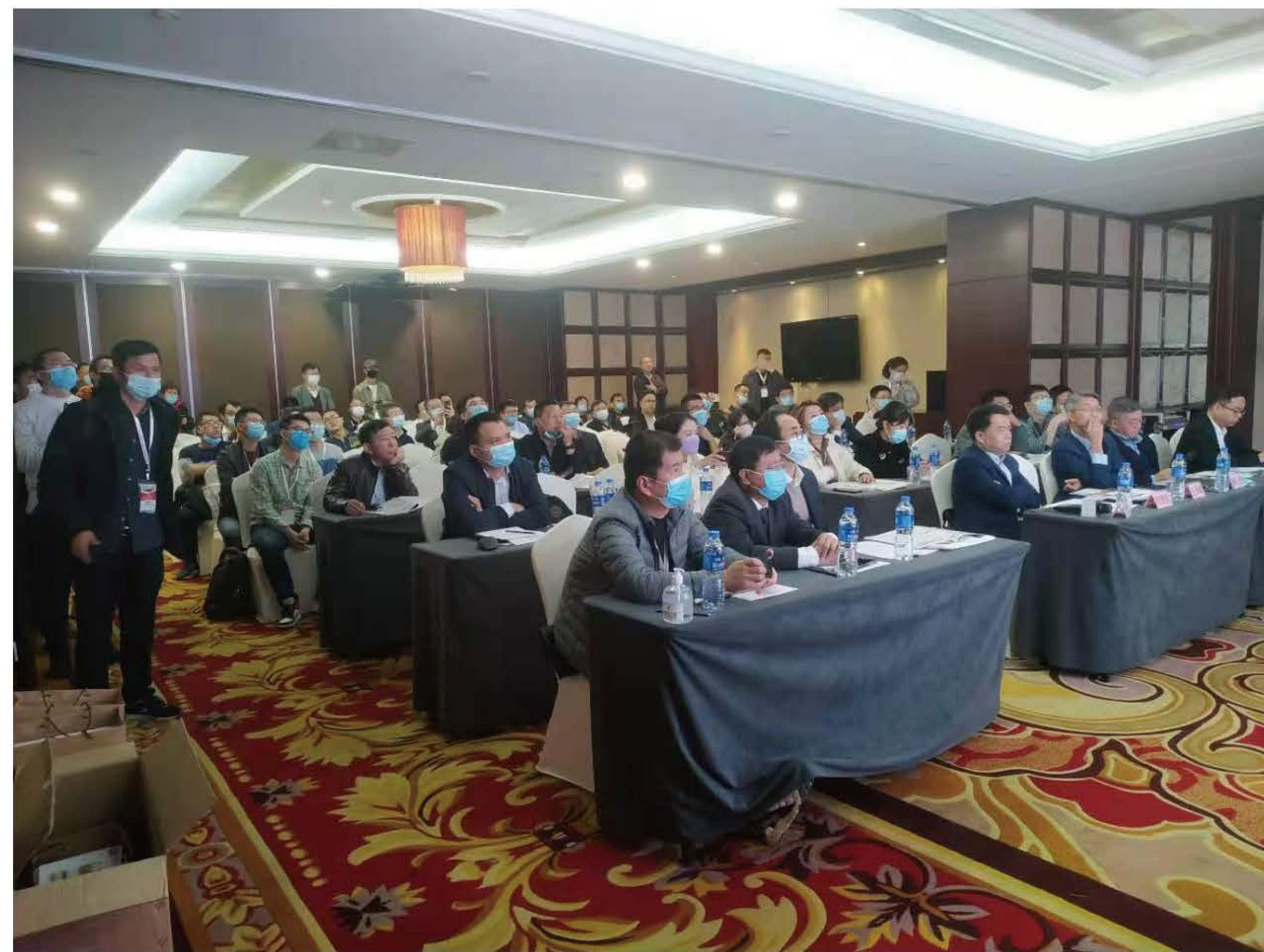
铸造模具创新技术发展论坛