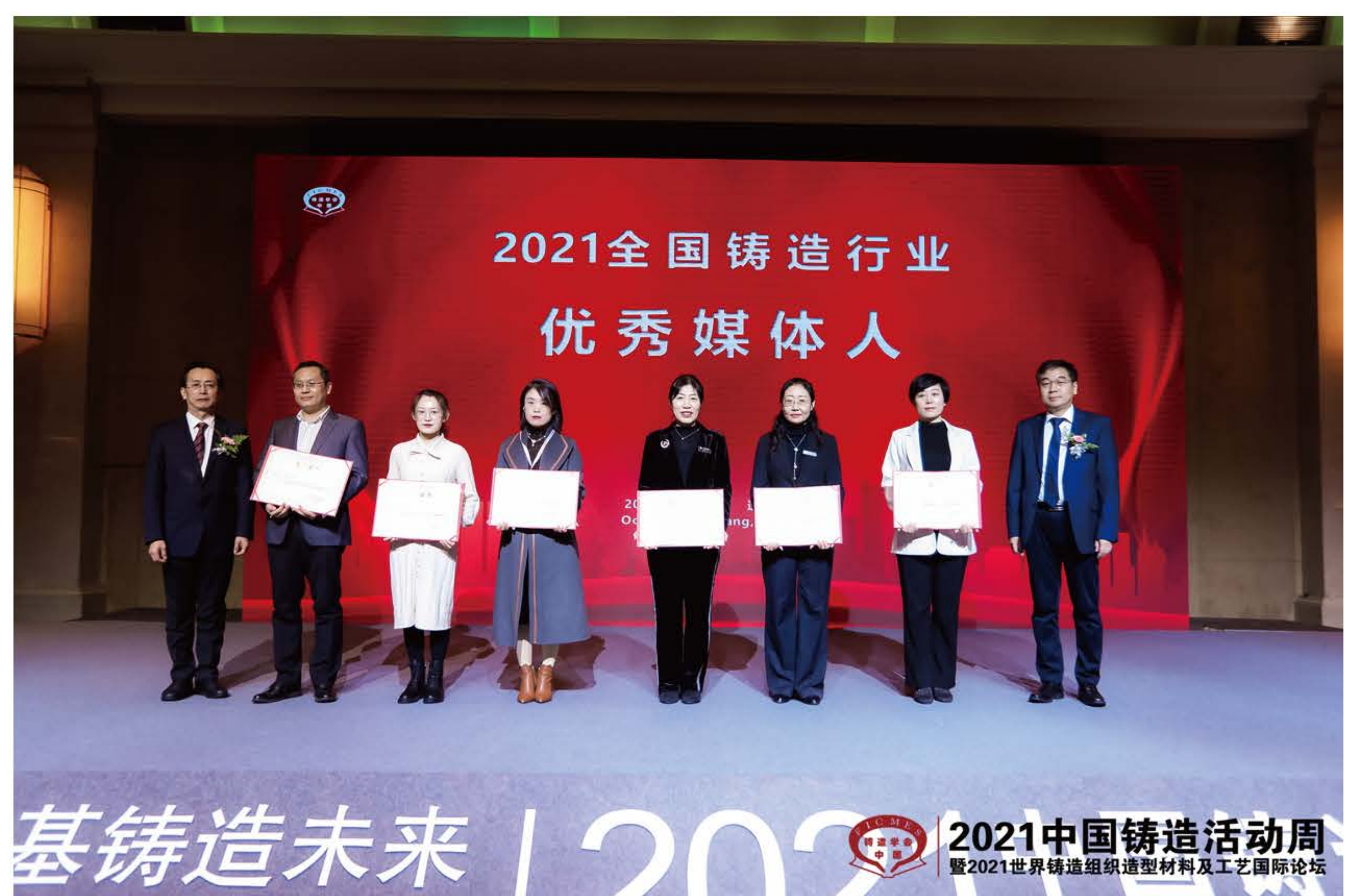
2021全国铸造行业优秀媒体人合影