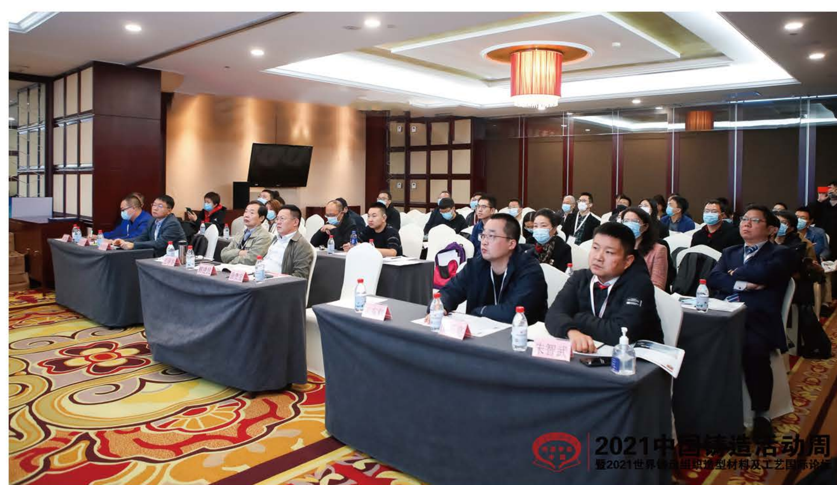
轨道交通关键铸件先进制造技术论坛