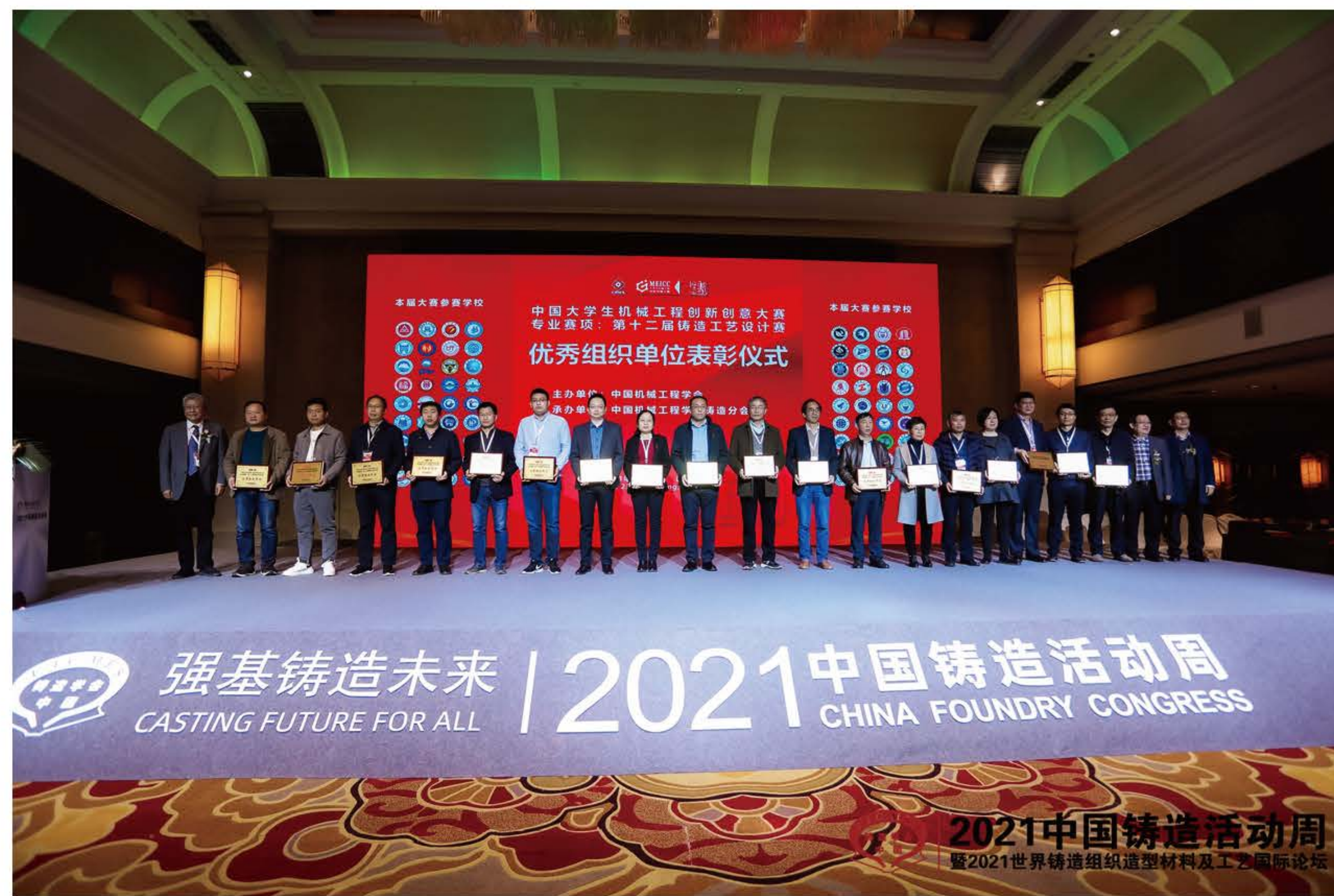
优秀组织单位获奖院校代表合影