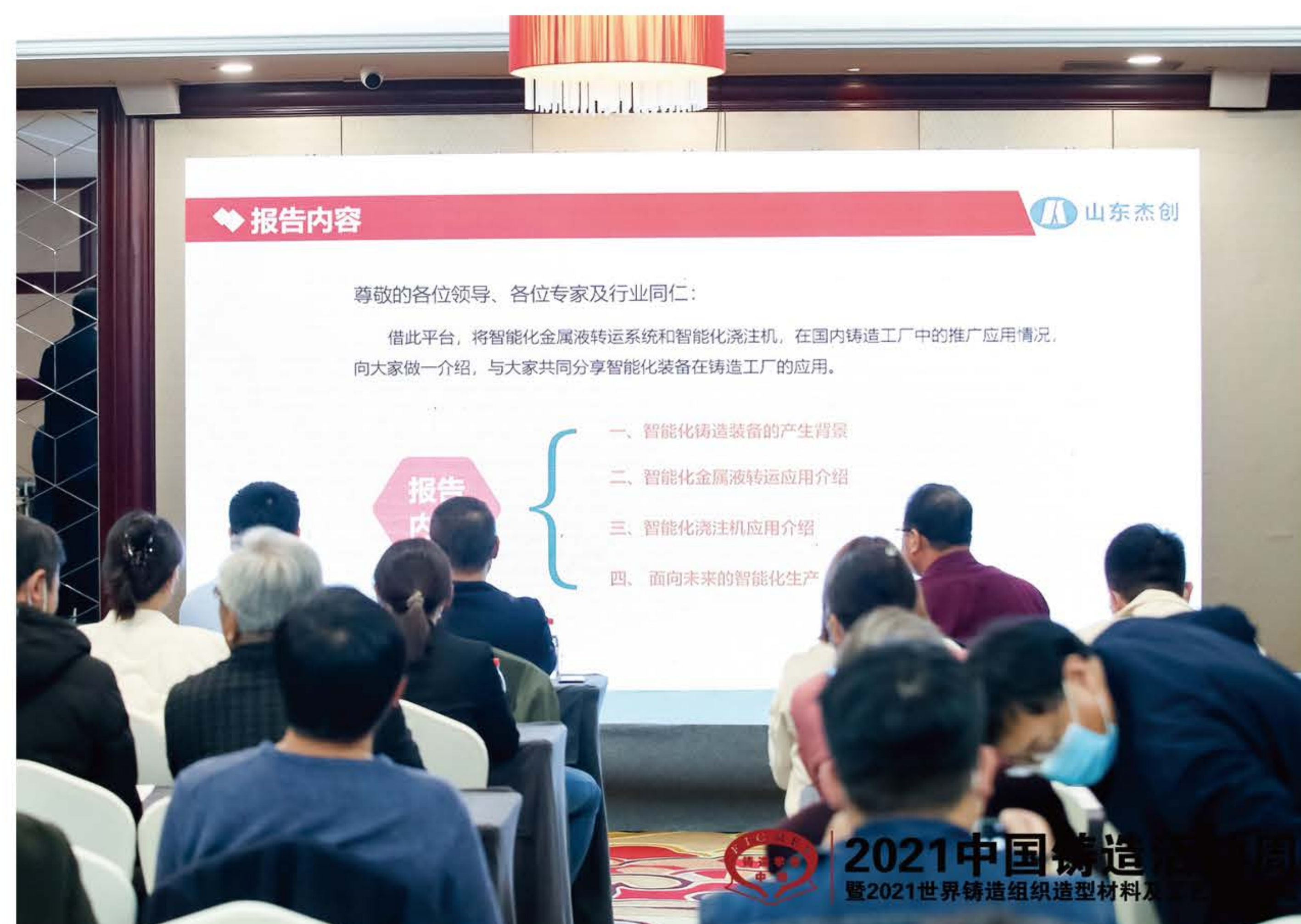
智能制造装备、后处理及检测技术发展论坛