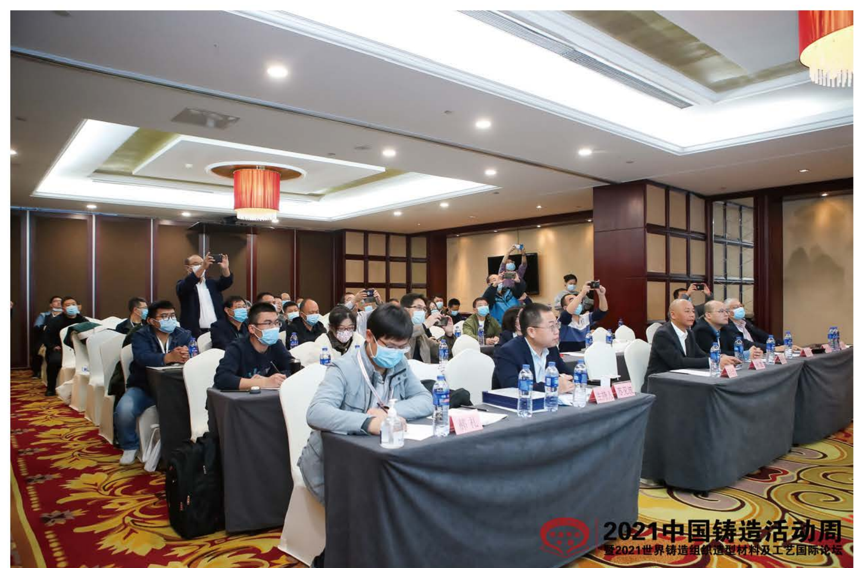
绿色铸造园区与智能铸造工厂规划建设论坛