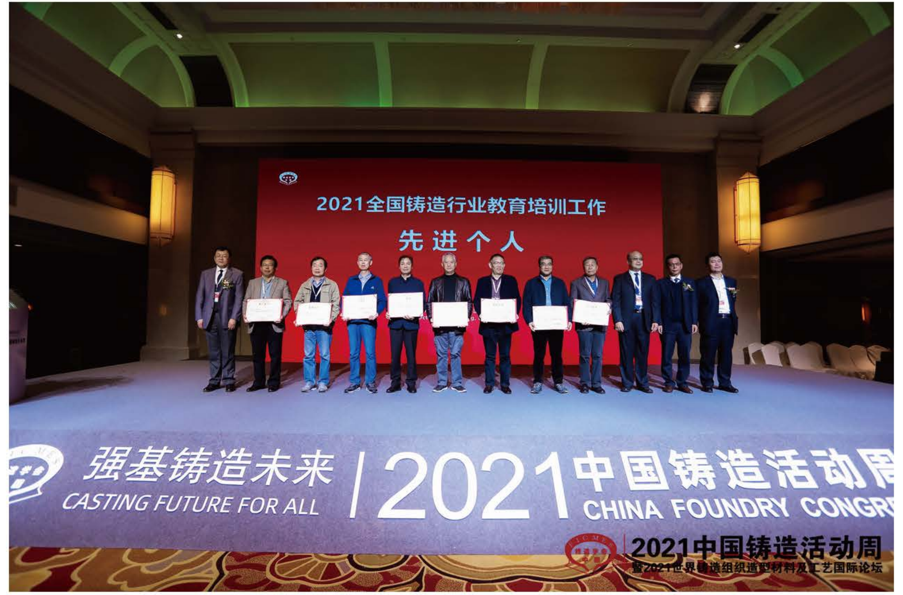
2021 全国铸造行业教育培训工作先进个人合影