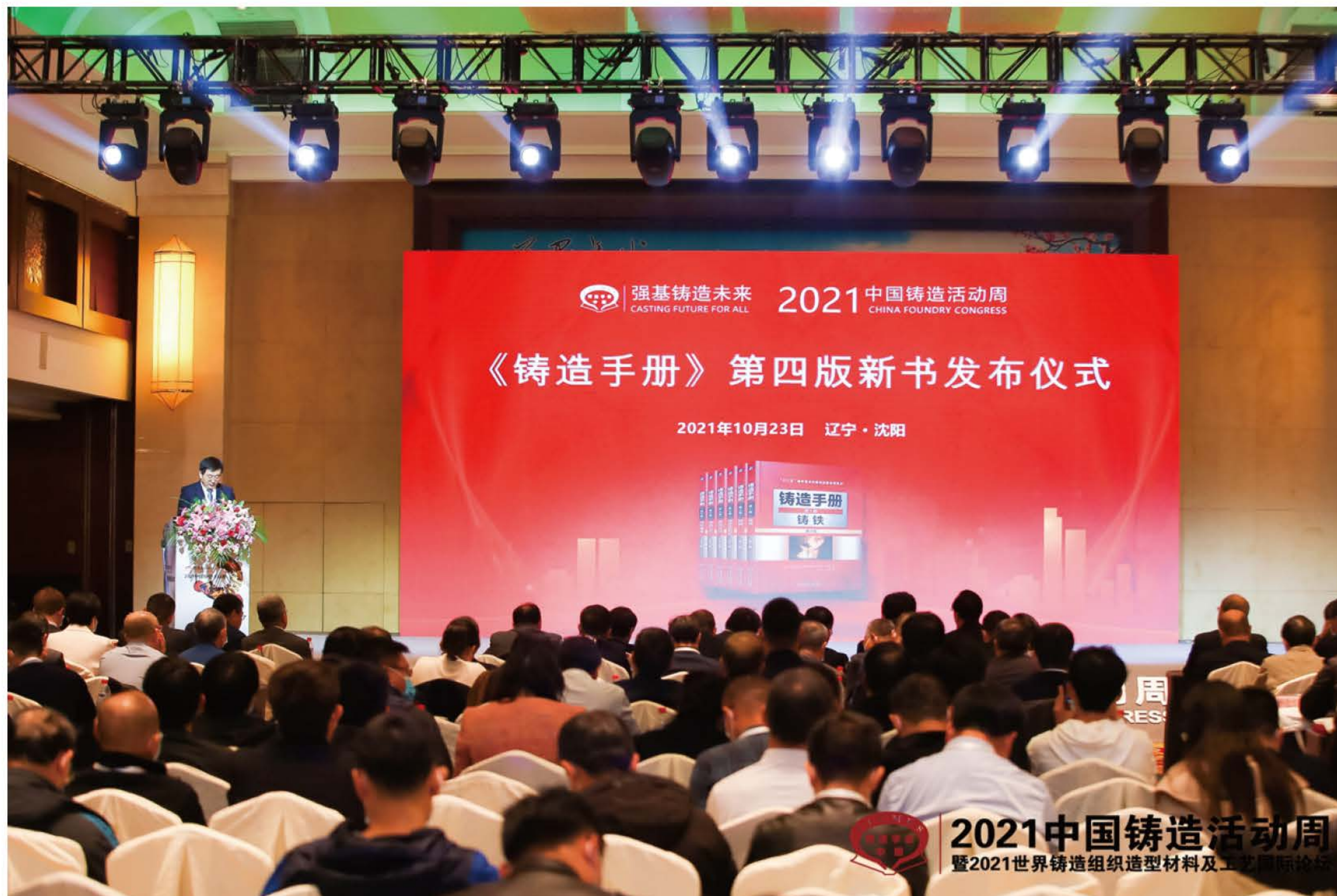
《铸造手册》发布仪式