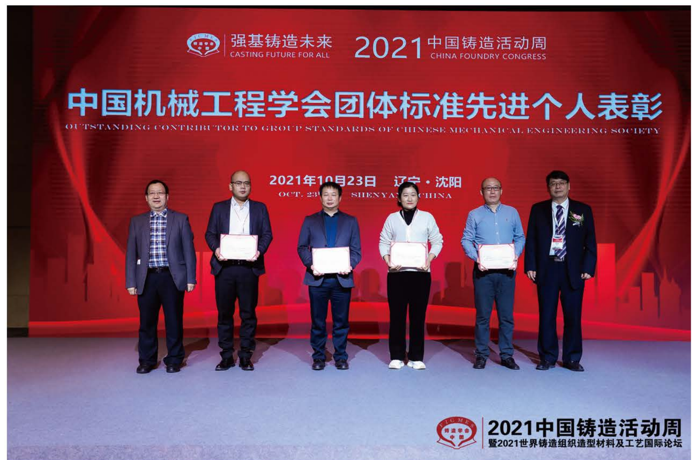
2020年度中国机械工程学会团体标准先进个人合影