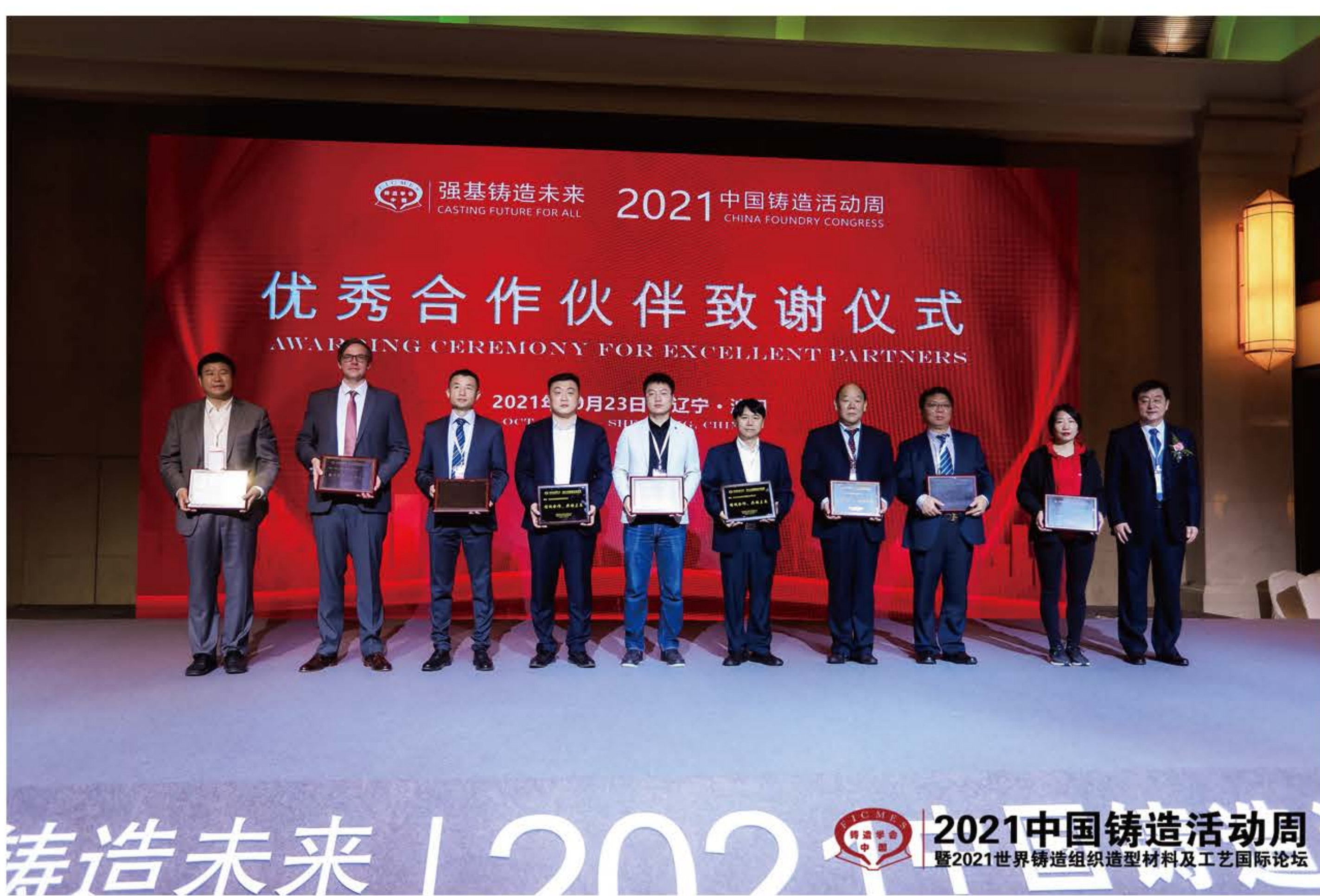
优秀合作伙伴合影