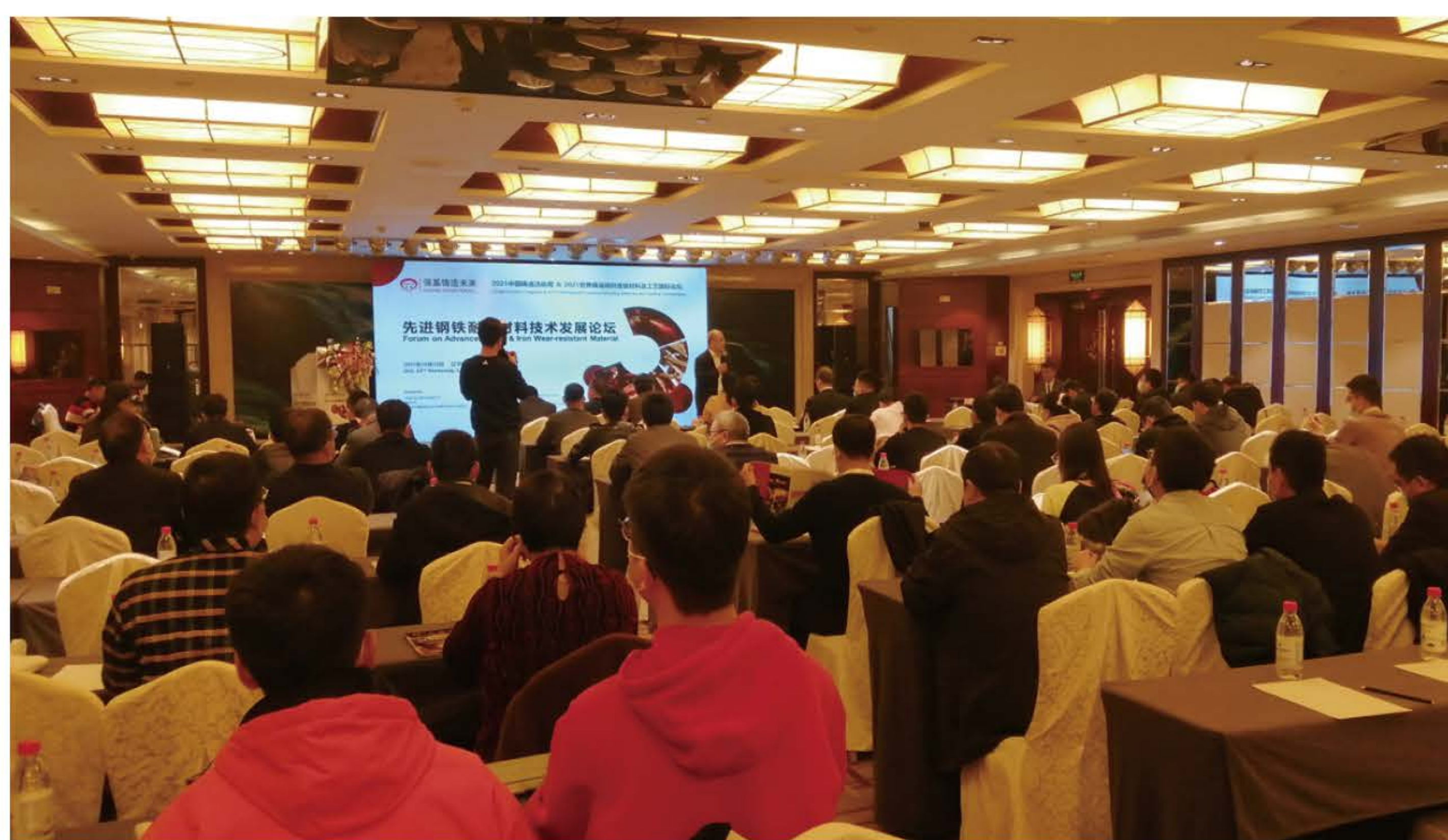
先进钢铁耐磨材料技术发展论坛