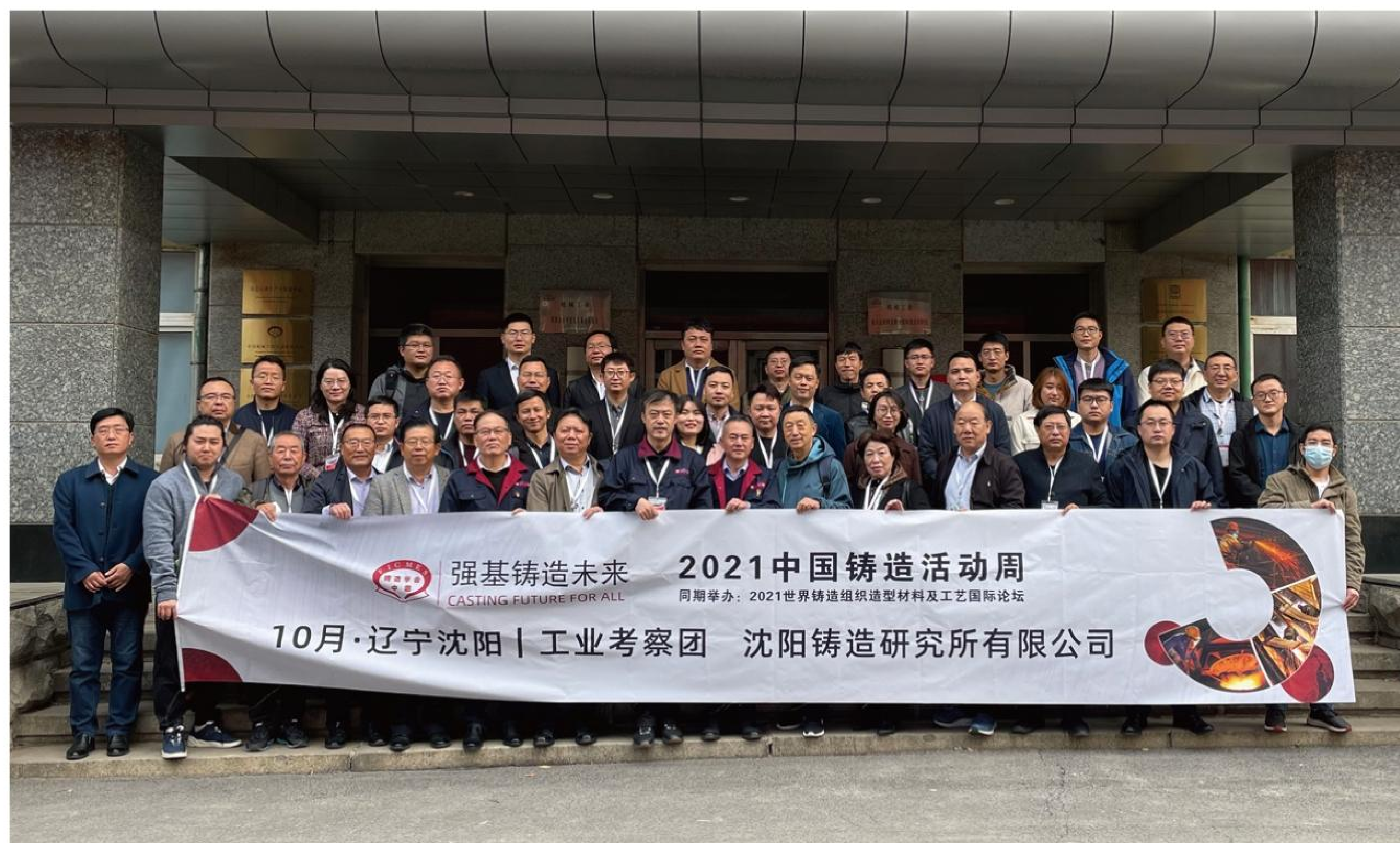
沈阳铸造研究所参观合影